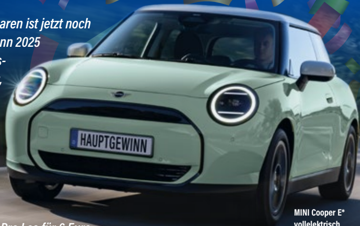
MINI Cooper E* vollelektrisch

4,50 Euro und investierst 1,50 Euro in dein Glück.